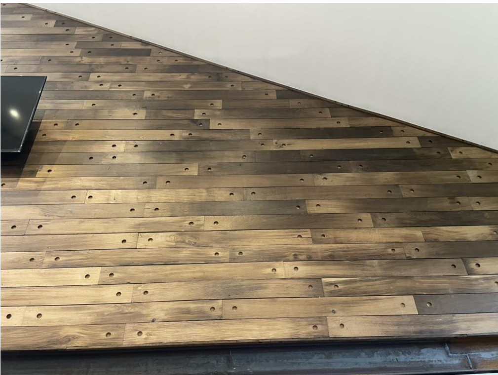
Revestimiento de muro con tabla de 10 X 1 X 100 con perforaciones