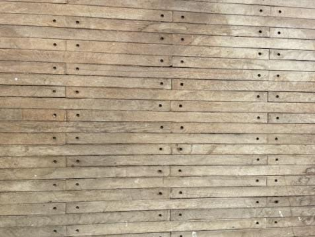
Piso realizado con tabla de 6,5 X 1 X 100 con perforaciones.