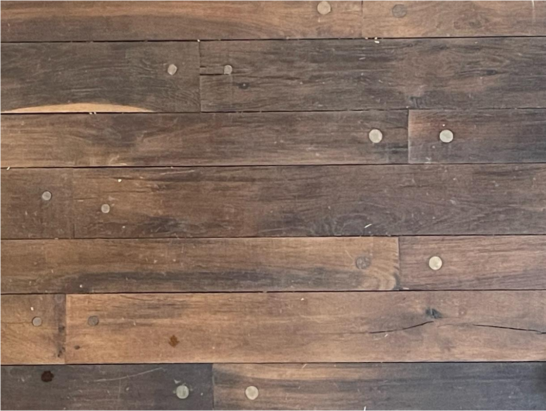
Piso con tabla de 10 X 1 X 100 con perforaciones tapadas con tarugo