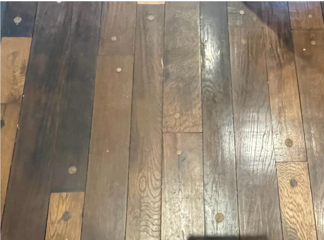
Piso con tabla de 10 X 1 X 100 con perforaciones tapadas con tarugo.