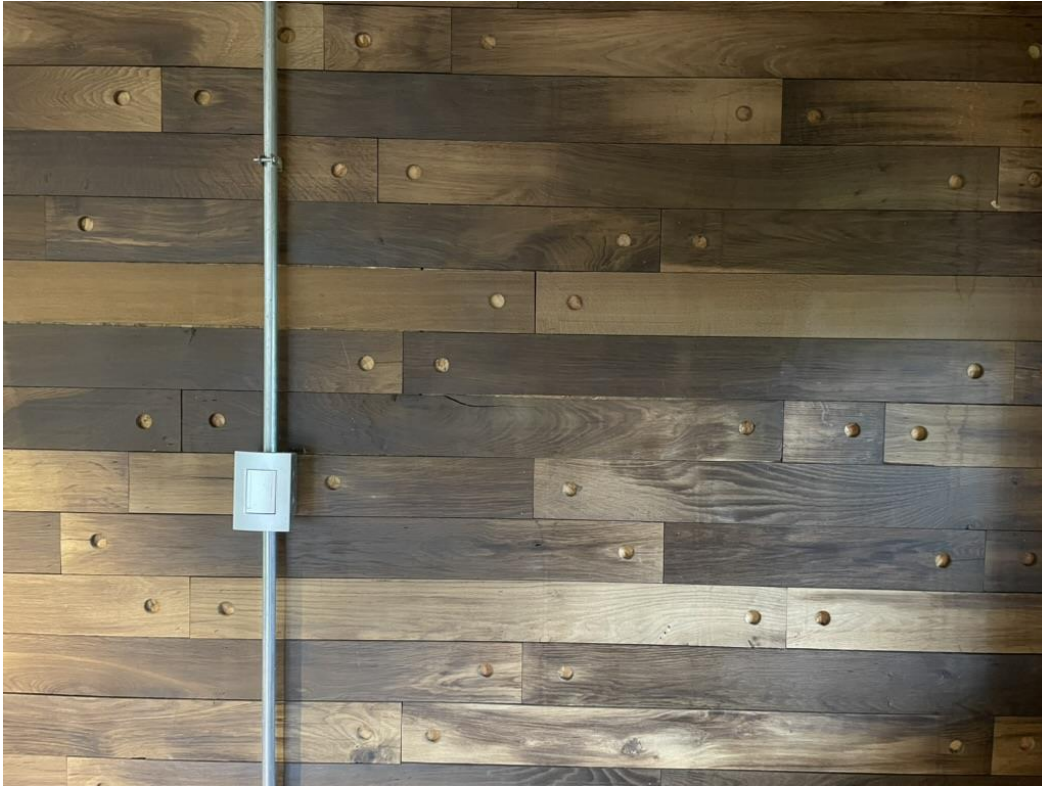
Revestimiento en muro con tabla de 10 X 1 X 100 con perforaciones